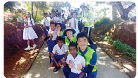
▲ 베트남 해외 봉사활동