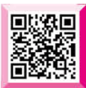
군특성화 소개 동영상