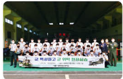
▲ 육군헬기정비 군현장실습