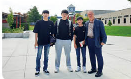
▲ 미국 SSC대학 유학생