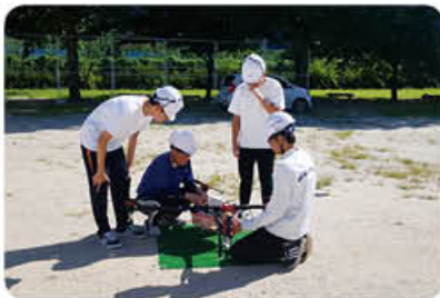
▲ 드론 면허증과정