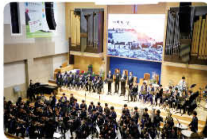
▲ 제6회 정기연주회