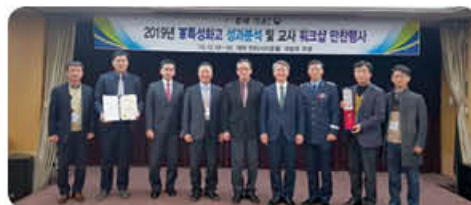
▲ 2019 전국최우수학교 국방부장관상 수상