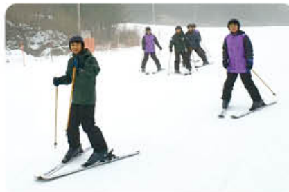
▲ 스키 캠프