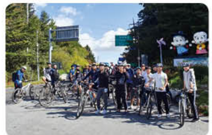
▲ MTB 동아리