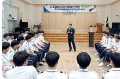
▲ 육군 항공작전사령부 71항공정비대대장