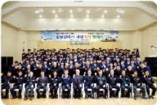
▲ 항공정비사 발대식