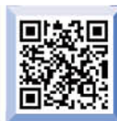
학교 소식지 리플릿