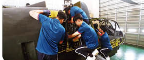
▲ 육군 군 현장실습