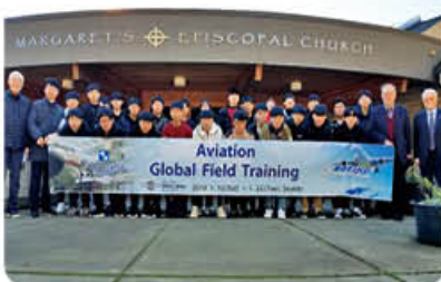
▲ SSC대학 연수