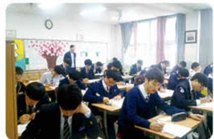
▲ YBM 토익시험