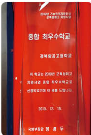
▲ 2019 전국최우수학교 국방부장관상