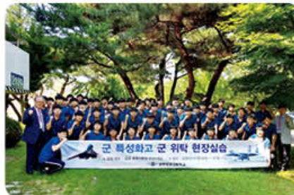
▲ 공군항공기정비 군현장실습