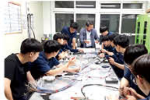
▲ 항공기 배선장치 수업