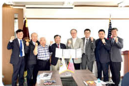
▲ 미국 미드웨스트대학교 협약