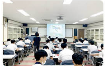
▲ 심미안 강좌