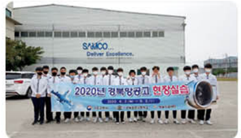
▲ 샘코 현장체험