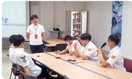
▲ 현장 맞춤형 교육과정 운영