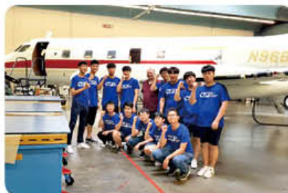
▲ 시애틀 글로벌 현장학습