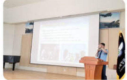
▲ 항공전문가 특강