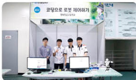
▲ 수학동아리 영주창의축전