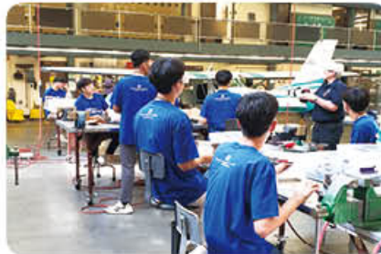
▲ 항공기 기체정비교육