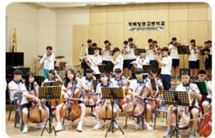
▲ 예술 동아리 발표회