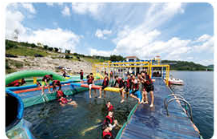
▲ 수상스키 캠프