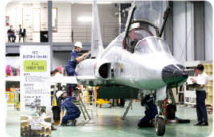
▲ 제3회 전국항공정비기능대회 비행전점검