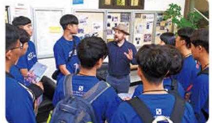
▲ 해외유학반 수업