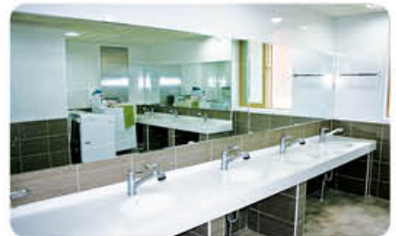
▲ 화장실 및 세면실 전경