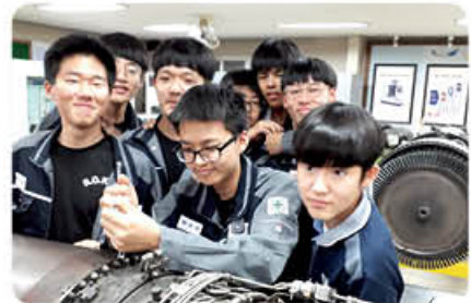
▲ 항공기 기관정비교육