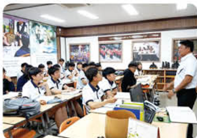
▲ 미국 FAA반 수업