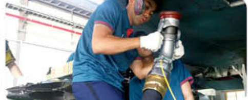
▲ 공군 군 현장실습