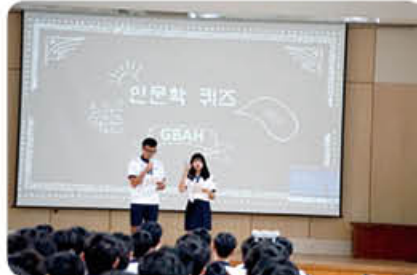
▲ 인문학 퀴즈 대회