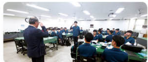
▲ 군 특성화반 추수지도