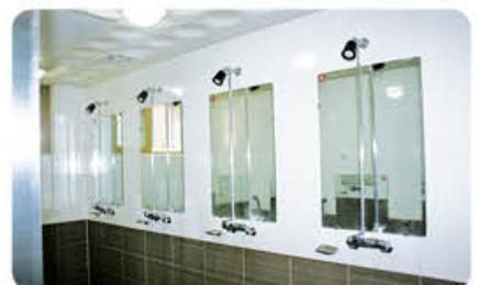
▲ 샤워실 내부 전경