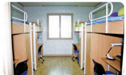
▲ 2인 1실 또는 4인 1실 룸 시설 내부 전경