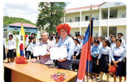
▲ 캄보디아 학교 항공 교육지원