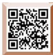
항공정비사 소개 동영상