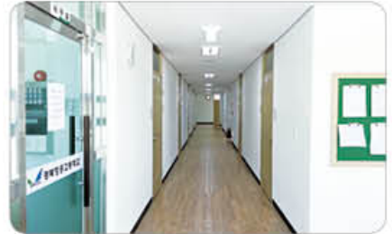
▲ 전 기숙사 냉·난방 시설완비