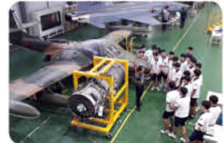
▲ 고정익 항공기반 수업