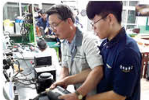
▲ 항공기 계기장치 수업