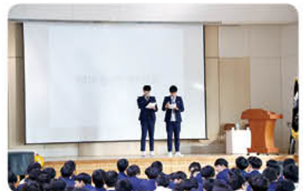
▲ 인문학 퀴즈대회