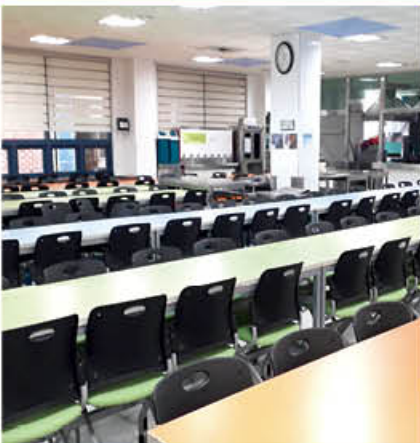
고품격 학생식당 실내 전경