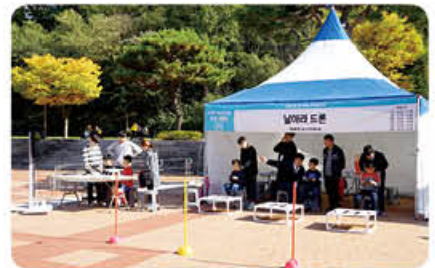
▲ 드론동아리 페스티벌