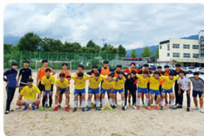
▲ 스포츠 반별 리그