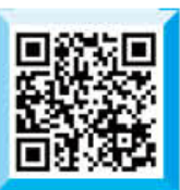
경북항공고 소개 동영상