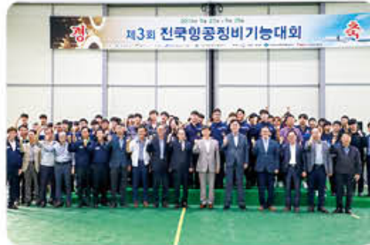
▲ 제3회 전국항공정비기능대회 수상자